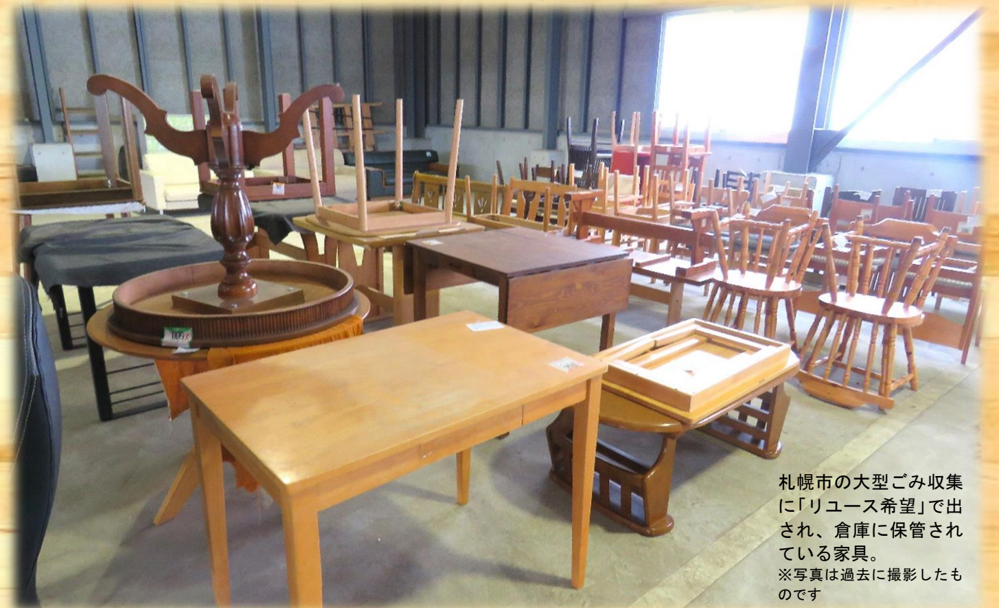
札幌市の大型ごみ収集に「リユース希望」で出され、倉庫に保管されている家具。 ※写真は過去に撮影したものです