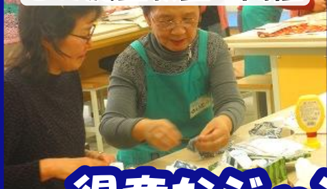
ごみ減量教室の開催