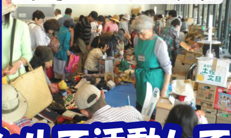
環境イベントに参加