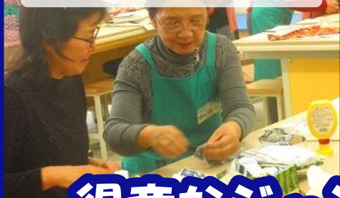
ごみ減量教室の開催