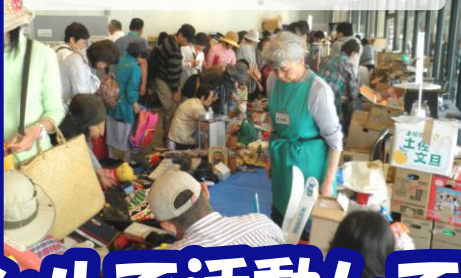
環境イベントに参加